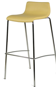
S 407 S