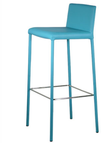
S 417 SH