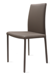
S 417 Q