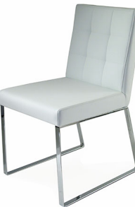
S 410 P