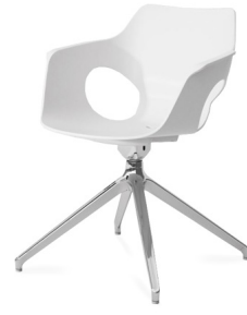
S 447 P