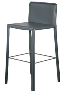
S 417 S