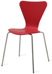
S 406 L